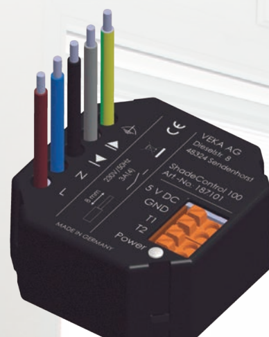
VEKA ShadeControl 100

São acionados através de módulos táteis especialmente desenvolvidos para serem integrados esteticamente na janela.